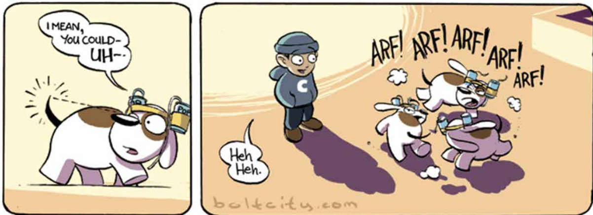
2 – Kazu Kibiushi (2005): Copper #25: Arcade30

Zusätzlich stellt er mit noch schärferen Unterscheidungsparametern fest: auch für automatisierte, geloopte Bewegungen (wie in demien5s gepriesenem Online-Meisterwerk When I am King 32 ) gibt es bereits Print-Präzedenzfälle: Obelix, der seine Fäuste im Kreis schwingt, oder ein Hund, der seinen eigenen Schwanz jagt (Bild 2).